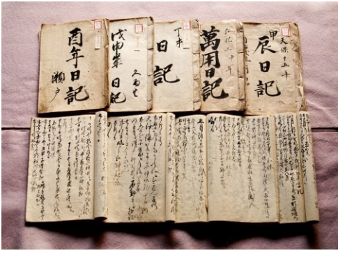
須田家日記 (飯能市ホームページより)

今回は、『卯日記』(天保十四年)の一月から六月まで、当時の小瀬戸村を舞台に、村運営上の出来事や事項を取り上げて話題提供としたいと思う。不明箇所に加え読み違え等もあるかと思うので、お気付きの節はご教示いただきたい。後日、また機会があったら、続編をと考えている。