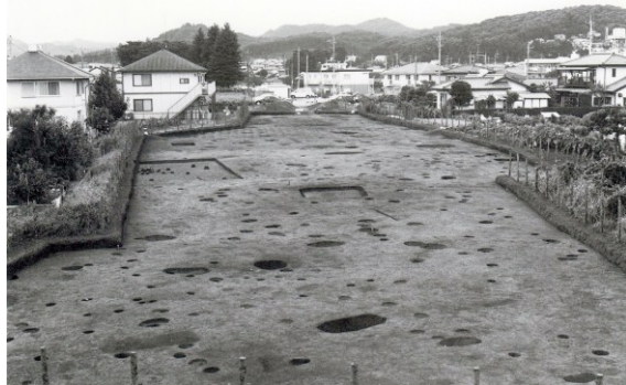
旭原遺蹟全景(東から) (『埼玉県埋蔵文化財調査事業団報告書第324集』、平成18年3月、埼玉県埋蔵文化財調査事業団より「図版22 飯能市上町東/旭原」)

飯能遺蹟は右記のほか各所に年代別に点在します。現在も時代区分に応じて発掘調査をしています。これから先も続いて行くと思います。今回の原稿はここまでと致します。 「序章」第一章、第二章、第三章、四章、五章、六章、と続きますが、「日本史」と平行して地方史として、近隣の郷土史も飯能史に関連した事柄も含めて記述して行きたいと思っています。機会あれば又書かせて頂く事もあると思います。