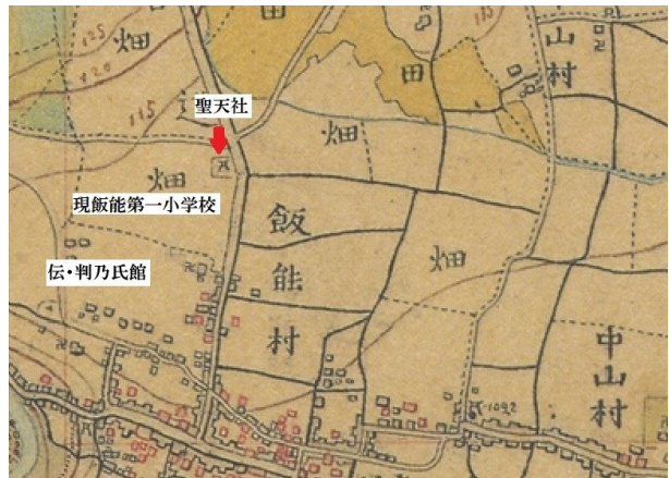
明治時代(農地変換地図)