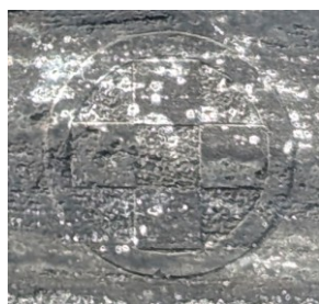
土屋氏の家紋 笹井宗源寺の土屋氏墓所より

法号「正春院殿」の上には土屋家 の家紋(丸に四つ石紋)が彫られて いる。つまり、この宝篋印塔は土屋 夫人のものであると考えられる。忠