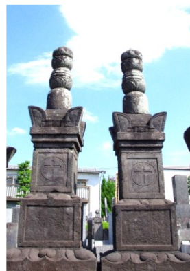
天桂寺の宝篋印塔

忠正は寛永五年(一六二八)に、 父母の供養と、自分たち夫婦の逆修 のための宝篋印塔を造立している。 この塔は初め長光寺にあつたらし いが、後に杉並区の新井に移され ている。この天桂寺は、忠正が寛永 二年(一六二五)に成宗・田端(今 の杉並区)の領主となつた後、同十 年(一六三三)に建立したものであ る。(新編武蔵風土記稿では忠正の 父である忠吉の事績としているが、 忠正の誤りであろう。後に、長光寺 に代わって菩提寺となり、孫の忠豊 から代々の葬地となつた。) 並んでいる塔に向かつて左側が 忠吉、右側が忠正の塔になる。忠吉 の塔の銘は、