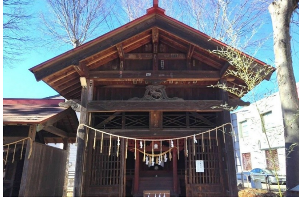
加能神社(旧聖天社)

はないかと思う。以上のことから、その意味は置いておくにしても、「ハンノウ」は製鉄・鍛冶に由来しているのではないかと考える。