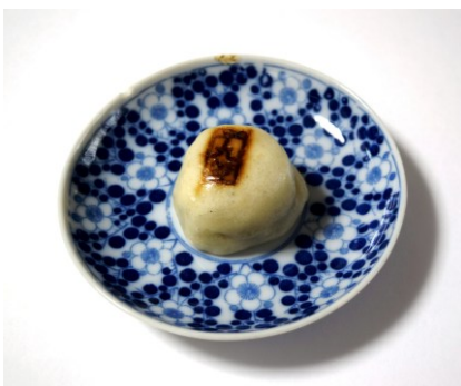
平九郎まんじゅう

現在は焼印が中山茶屋にあるところで、平九郎まんじゅうはイベント等での限定販売だそうです。白色で一口サイズなので、島田利重氏が復活した平九郎まんじゅうを模したものでしょう。脚光をあびた渋沢平九郎ですが徐々に意識は薄れ、その名を冠した商品も限定販売になったということでしょう。