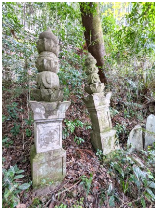
小瀬戸岡部氏墓地の宝篋印塔

現在の飯能地域の在り土豪であ った岡部氏については、史料も遺蹟 も失われたものが多く、よく分か らないことが多い。例えば小瀬戸の観 音堂の麓には岡部氏の墓地があり、 ここには二基の宝篋印塔がある。