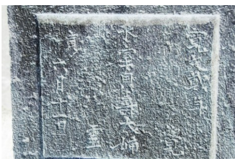
銘の写真を階調反転したもの

正が亡くなったあと落飾して「正春 院」となったのである。そして忠 正没後の十五年後の寛文二年に亡 くなったのではないか。仮に土屋夫 人が忠正と同齢であったとしたら