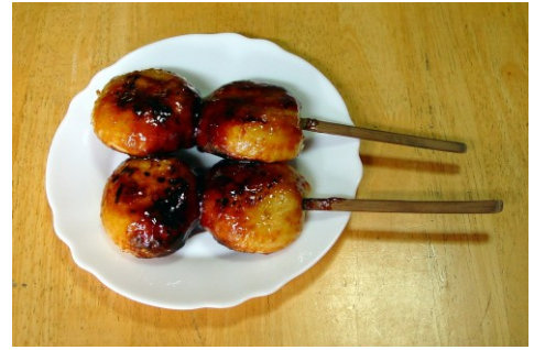
味噌付けまんじゅう

味噌付け饅頭の起源といわれています」とありました。調べてみると、味噌付けまんじゅうの表記はバラバラです。味噌付けまんじゅう、飯能みそまんじゅう、飯能まんじゅう、みそつけまんじゅう等々、わかればいいんだ、くらいのもんです。「文化新聞」昭和61年4月20日の「古い時代と話し合う会」では、「どこで作り始めたものか話合ったが、はつきりしなかった。：中に塩餡もあったかと思う」とあります。いつのまにか売っていた食べ物で、その昔は餡が甘いとはいえなかったようです。「夏場でも腐らない」は一説にすぎません。餡がない群馬の焼きまんじゅうを考えると、味噌付けは甘味に代わる味ではないでしょうか。なお私は弁当云々の根拠が分かりません。味噌付けまんじゅうの呼称の一つに、飯能まんじゅうがあります。